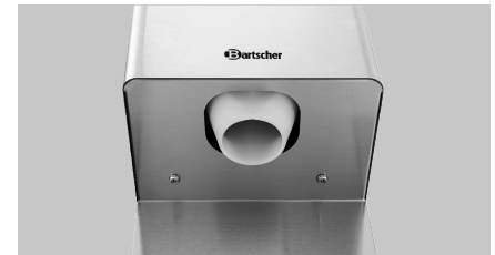
► Direktes Auffangen mit dem Glas möglich