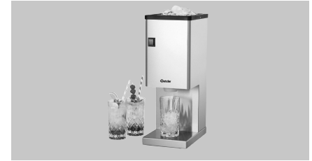
► Eiscrusher mit Auswurftrichter